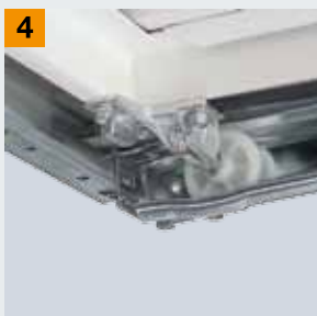
Parkering til kørerullerne

Ønsker du mere sikkerhed? Så henvend dig til din Hörmann-forhandler!